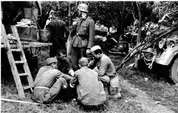
„Russische Gefangene arbeiten für die Feldküche“