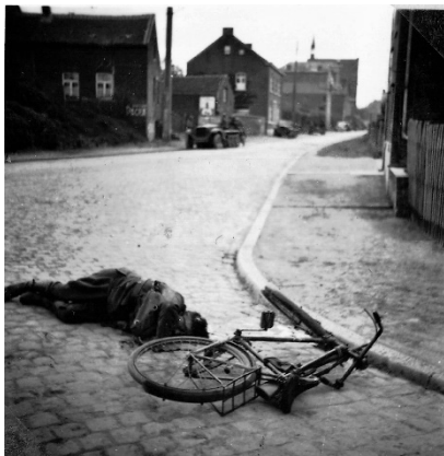
„Belgien (im Hintergrund Helmut's Zugmaschine)“