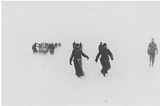
„Stepanowka Februar März 1942“