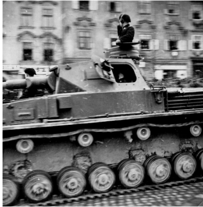
„Parade in Iglau“