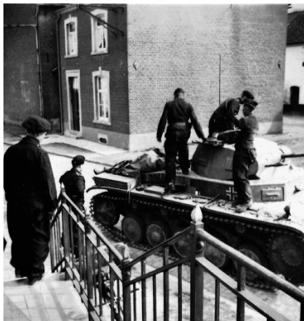
„Tote werden zurückgebracht“