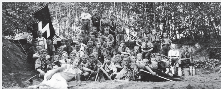
Hitlerjugend im Wieratal